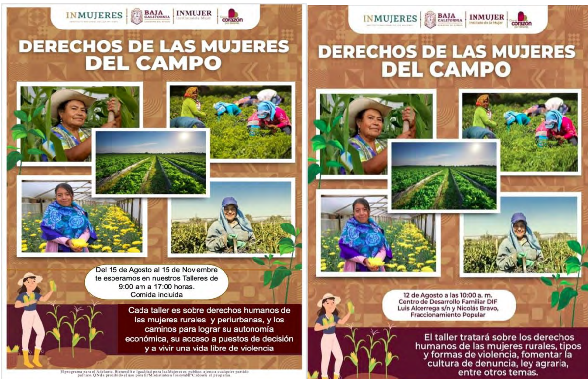
Ilustración 1.- Flyer General y por Taller

LOGRO: se elaboró un Flyer genérico de invitación permanente en el periodo del proyecto, más con Flyer’s específicos que informan sobre el lugar de cada uno de los talleres realizados, enseguida los Flyer’s a modo de ejemplo.