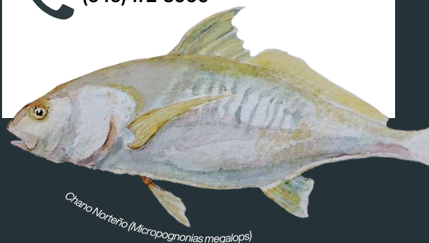
Chano Norterio (Micropogonias megalops)