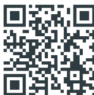
Sistema Nacional de Información de Pesca y Acuicultura (SNIPA)

Obtendrás un registro numérico como el siguiente: