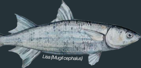
Lisa (Mugil cephalus)