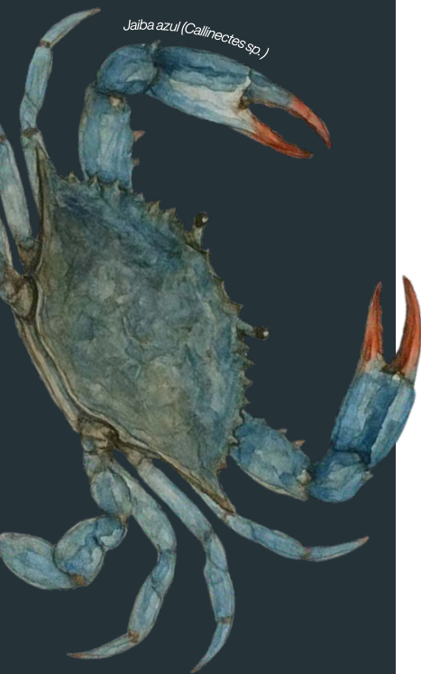
Jaiba azul (Callinectes sp.)