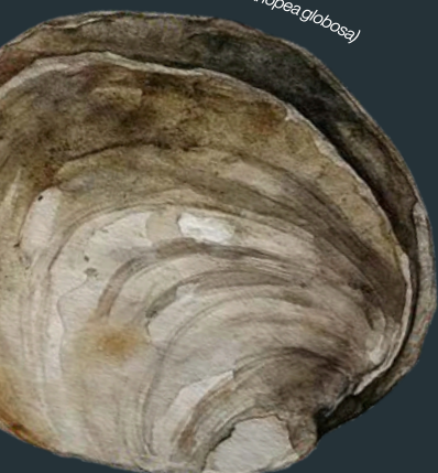
Almeja globosa (Panopea globosa)