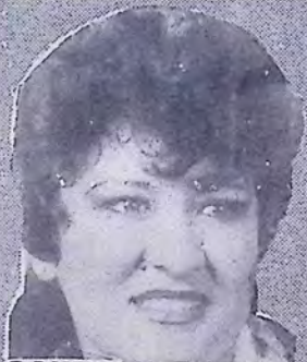
SAIURI la baladista de "la Voz de Ensueño"

FF el ambiente juvenil del grupo "ESCALA CHICANA"