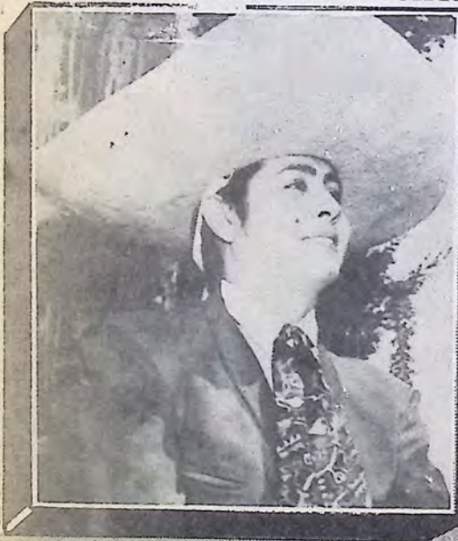
CAIN CORPUS El cachanilla