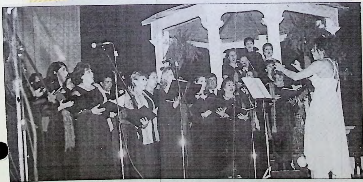
El coro de la Universidad de Sonora interpretó algunas piezas del autor homenajeado en el Auditorio Cívico del Estado.

No podía faltar el primer intérprete de su famosa canción "Puro Cachanilla",