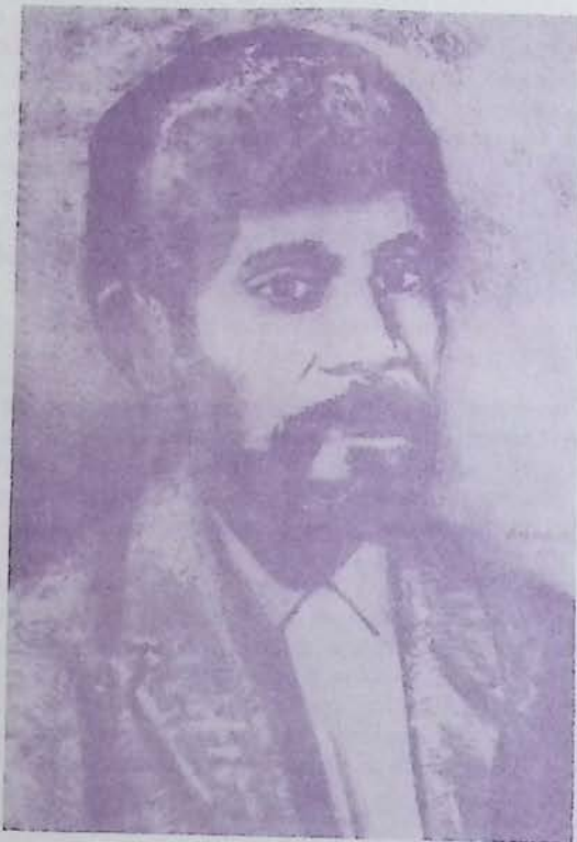
GRAL. D. MANUEL LOZADA

Uno de sus últimos retratos del gran revolucionario.