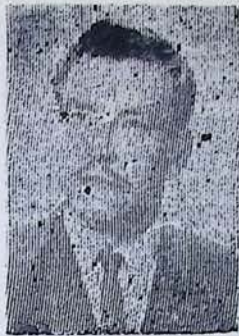
Por Valdemar Jiménez Solís

Cristo: si al mundo regresaras, volverías a ser crucificado; porque tú, si a la tierra tornarás, enseñarías de nuevo tu evangelio: el "amaos los unos a los otros", principio universal hoy olvidado; y estarías en contra de las guerras, aún de aquellas que en nombre de la paz se hacen a diario, como la más injusta y detestable: la indignante masacre de Vietnam.