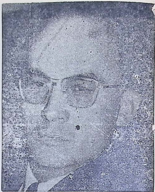
Presidente Luis Echeverría

mosa Barca, por eso mis letras nombran La Moreña la viuda olvidada del destino pero no es así alguien en una hermosa tarde sintió el celo de su conciencia y vuelve generar la inspiración de aquella legendaria figura que fué la más grande inspiración de su vida para dejarla a la luz del tiempo para que un gran sucesor de sus bellas ideas hiciera renacer el genio perdido.