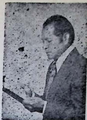
EN LOS TOROS

"te recordaré siempre; sigue llevándome flores". —El mensajero concluyó: —Siga usted viéndola tan linda, como ha dicho siempre en sus versos. —Ay "chingüenches", (como decía bromeando), cómo me dolió recibir este cruel mensaje; cómo me hacen falta sus telefonemas mañaneros. En su Memoria, nunca mas escucharé la música que tanto le gustaba; he roto los malditos discos para matar Recuerdos; también he roto su taza en que tomaba café negro; flores compraré, para su tumba, como me pidió; y nunca más leeré, mis versos dulces inspirados en ella.