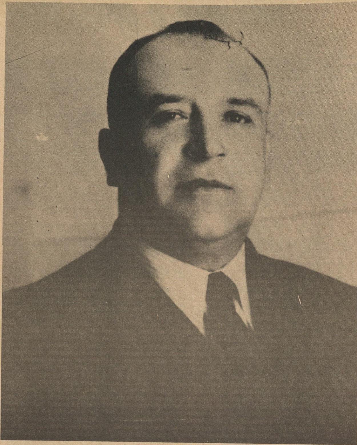
El entonces teniente coronel Rodolfo Sánchez Taboada al hacerse cargo del Gobierno del Territorio Norte de la Baja California, en marzo de 1937 a los 52 años de edad. Esta es la imagen que el pueblo bajacaliforniano guarda de su gobernante.