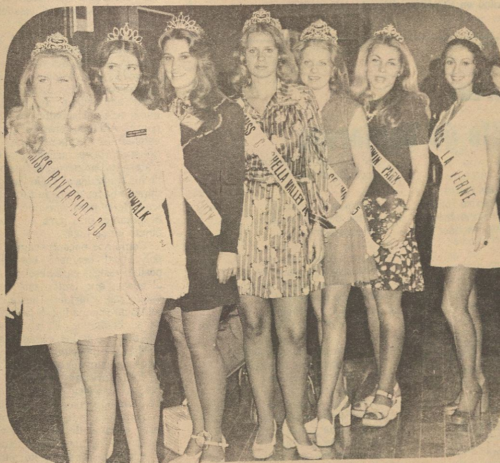
Este grupo de guapas y atractivas muchachas que participaron como finalistas en el Concurso "Señorita Baja California Internacional", a su retorno de Acapulco ocuparon las primeras páginas de sociales en la prensa del Estado.