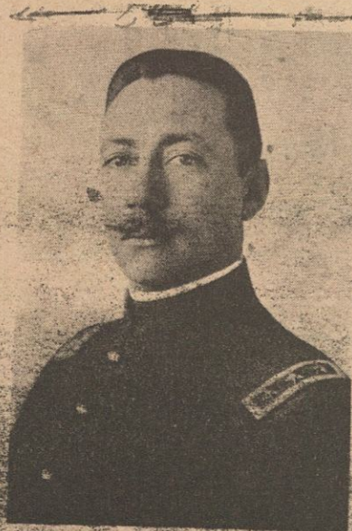
Coronel Esteban Cantú Jimenez, quien en 1915 al controlar las ambiciones políticas en la entidad, cambió la capital de Ensenada a Mexicali y él se dio el nombre de Gobernador.

“Secretaría de Gobernación -Sección Segunda”