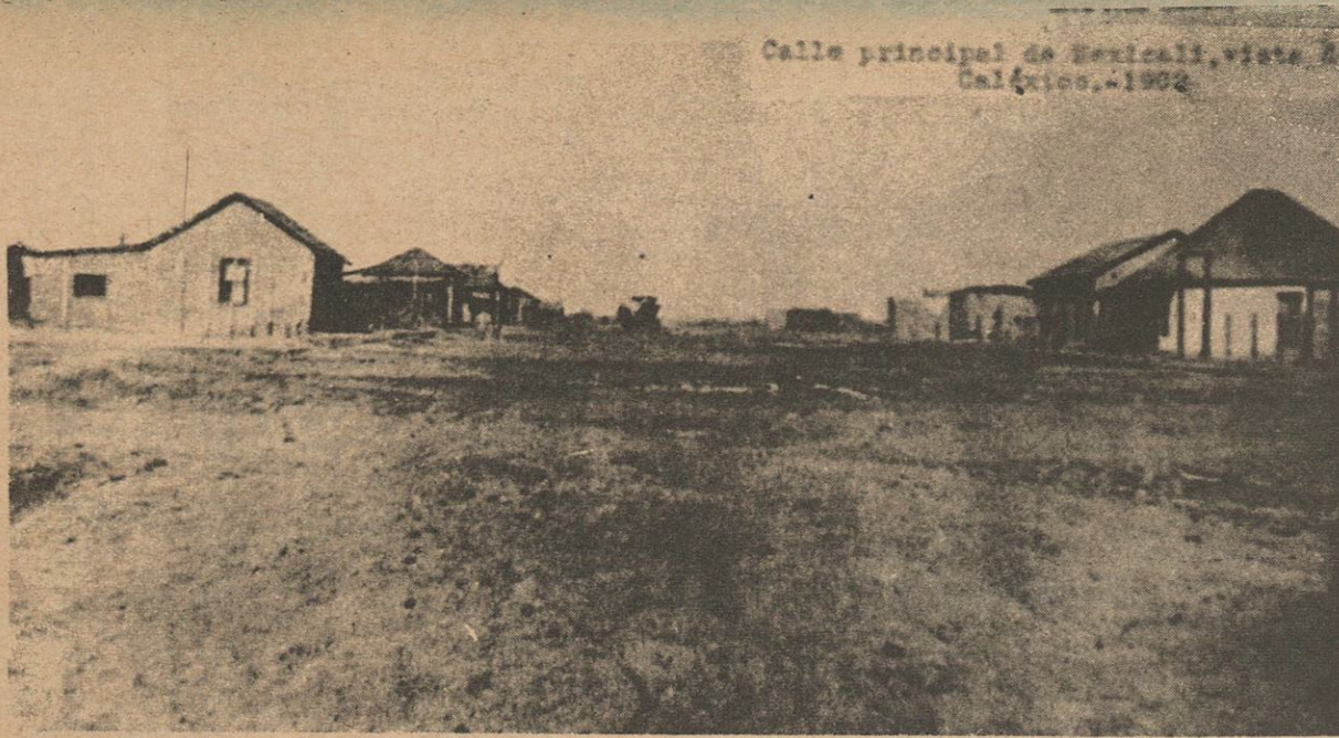
La Avenida Internacional de Mexicali vista desde la ciudad de Caléxico por el año de 1904. Estas primeras casas con otras mas fueron arrastradas por las aguas desbordadas del Río Colorado en 1906, surgiendo el nuevo Mexicali, que nueve años después sería transformado en la capital del Distrito Norte de la Baja California.

LA MAYOR parte de historiadores, escritores y periodistas que han tocado el pasado de nuestra entidad y en particular de nuestra joven ciudad, cuya historia ha resultado caprichosa y huidiza a su conocimiento y estudio, han mencionado mas de alguna vez en sus artículos y ensayos el Decreto del Congreso de la Unión que dividió el antiguo Territorio de la Baja California en dos Distritos, Norte y Sur, los que a partir de ese ordenamiento dependieron directamente del Ejecutivo Federal.