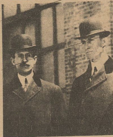
LOS HERMANOS WRIGHT

En los países del mundo que ahora están en desarrollo, los beneficios de la electricidad llegan ya a poblados que jamás habían gozado de ellos. Cada nueva central eléctrica bien puede mirarse como un nuevo monumento al genio de Nikola Tesla.