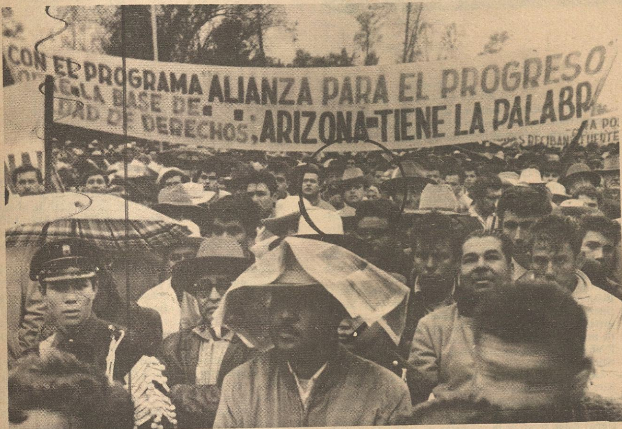
Otra fotografía tomada en la misma fecha, donde pueden apreciarse representantes de todos los sectores sociales, por lo que se consideró una agresión a los derechos de México sobre las aguas del Río Colorado conforme al tratado firmado en febrero de 1944.

ACIONES Y COMENTARIOS PERIODISTICOS PUBLICADOS EN EL DIARIO "ULTIMA HORA" EN AGOSTO DE 1956, ANO FUE DETECTADA LA SALINIDAD EN EL RIO COLORADO POR UNO DE LOS REPORTEROS DE ESA PUBLICACION