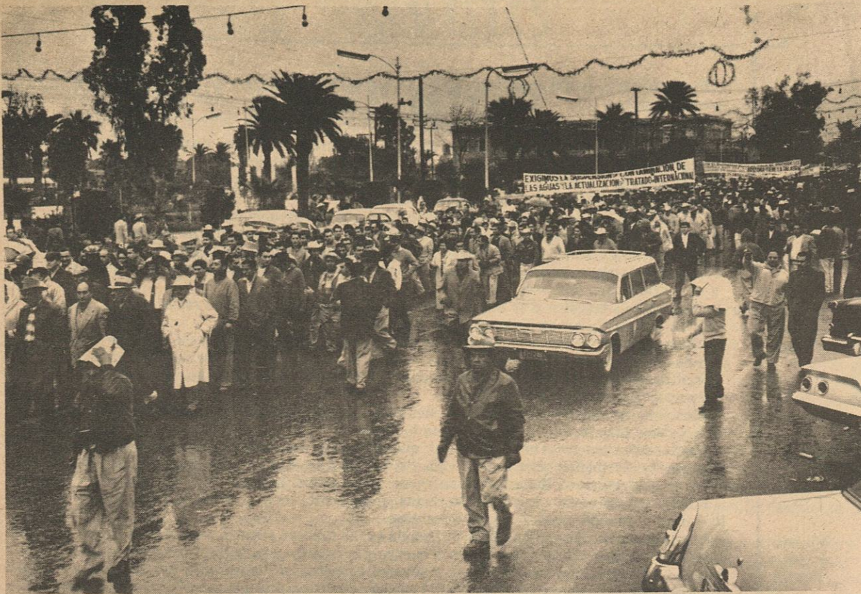
En el año de 1961, los agricultores del Valle de Mexicali, respaldados por el pueblo y gobierno de Baja California, llevaron a cabo una gran manifestación frente al consulado norteamericano, protestando por la contaminación del Río Colorado por las aguas fósiles del Wellton Mohawk.