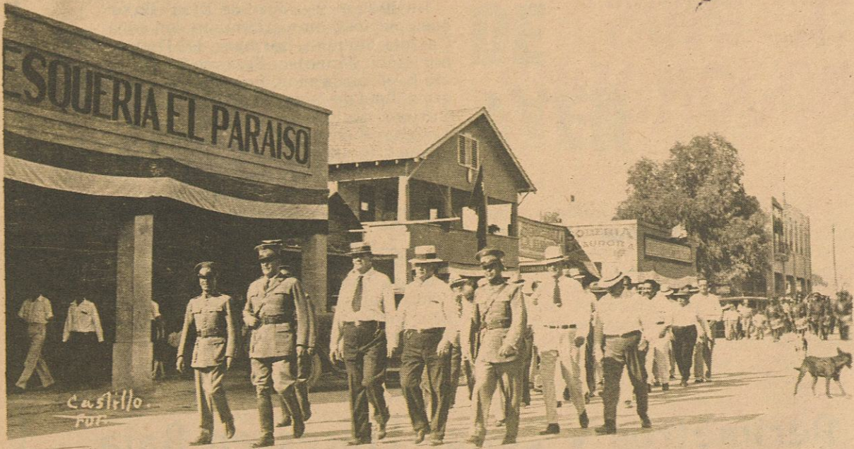
UN DESFILE en una celebración patria en Mexicali en 1925, pasando por la Avenida Madero, pudiéndose apreciar la Refresquería "El Paraíso", el Consulado Japonés, la sodería "La Aurora", la Refresquería "El Oasis" y el edificio Guajardo.

TRATAREMOS POR ESTA ocasión de complacer a algunos de nuestros lectores, forzando nuestra memoria para hacer una ligera descripción de nuestra hoy orgullosa ciudad de Mexicali por allá en los años 20.