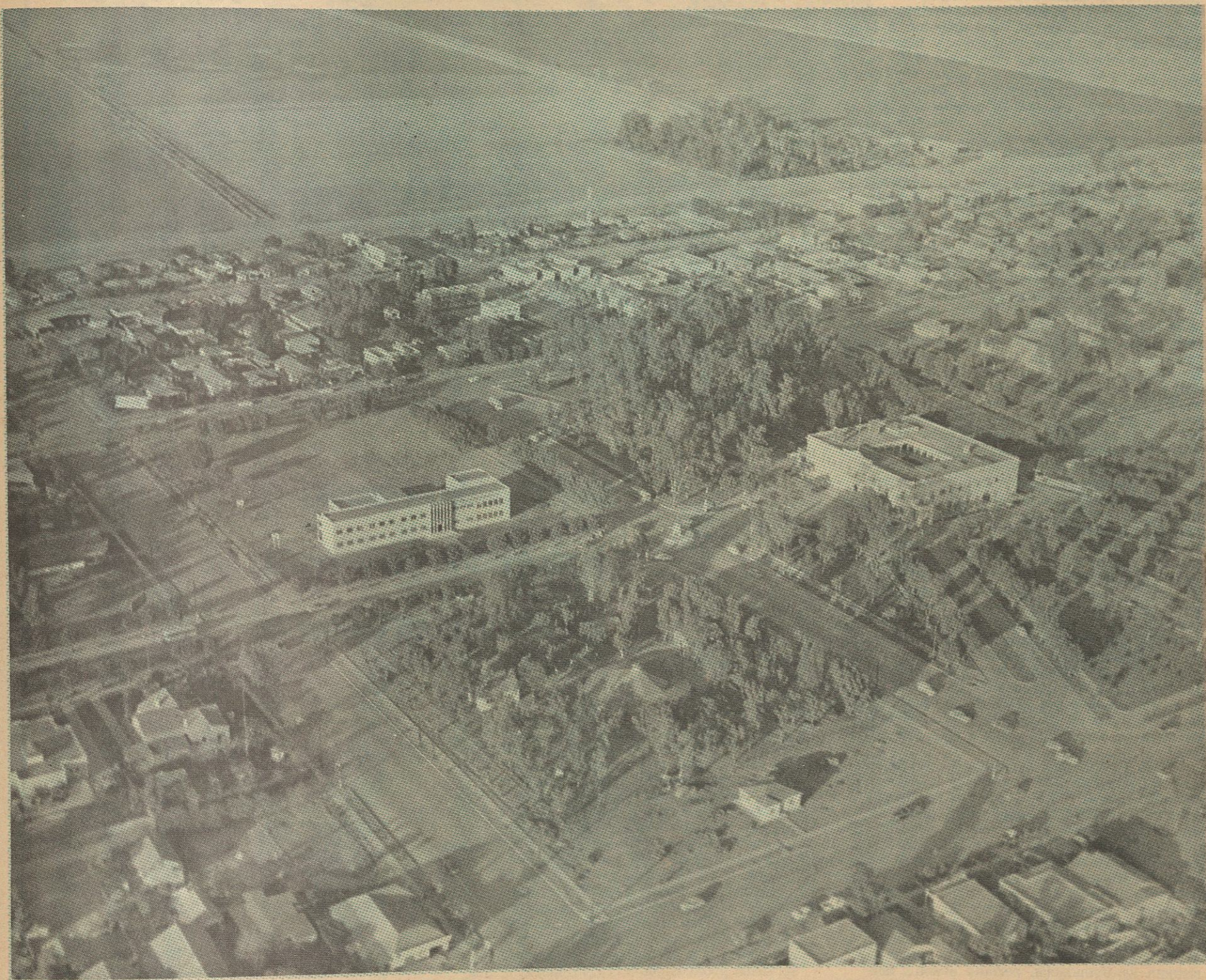
UNA FOTOGRAFIA del Palacio de Gobierno en 1945. En la misma panorámica las primeras instalaciones del Jardín de Niños "Federico Froebel" y la Escuela Secundaria Federal No. 18, entonces recién construida durante el gobierno del señor general Juan Felipe Rico Islas.