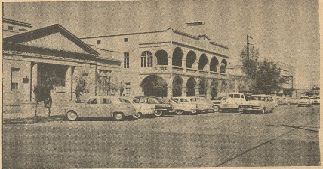
En 1923 la ciudad se extendía hasta la Calle Oriente (hoy Ley de Alfabetización). En esta fotografía cuatro importantes edificios: el Banco Nacional de Crédito Ejidal, la Cámara de Comercio, la Dirección de Turismo y la Compañía Telefónica.