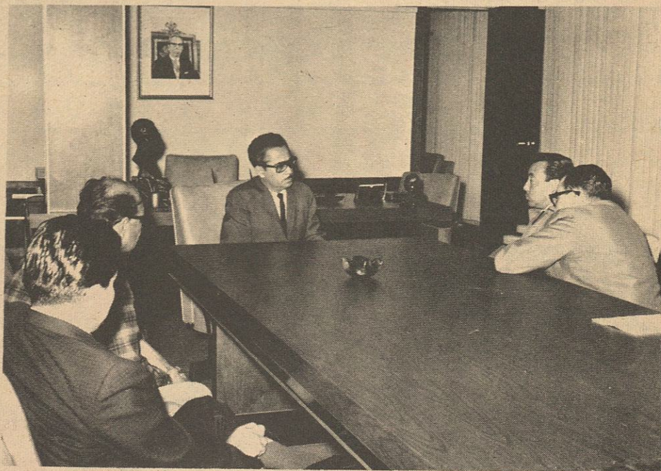
Casi siempre las controversias entre trabajadores y Estado se resuelven conciliatoriamente. En esta fotografía, el C. Gobernador del Estado, ingeniero Raúl Sánchez Díaz, atiende una comisión bipartita para resolver un problema de índole laboral satisfactoriamente.

El Tribunal de Arbitraje es competente para resolver en definitiva conflictos individuales entre alguno de los Po-