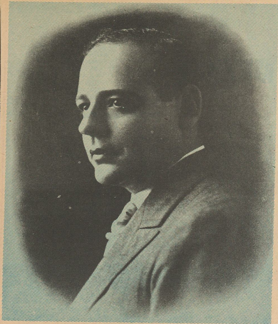
General de División Abelardo L. Rodríguez, Gobernador del Distrito Norte de la Baja California de Octubre de 1923 a diciembre de 1929.