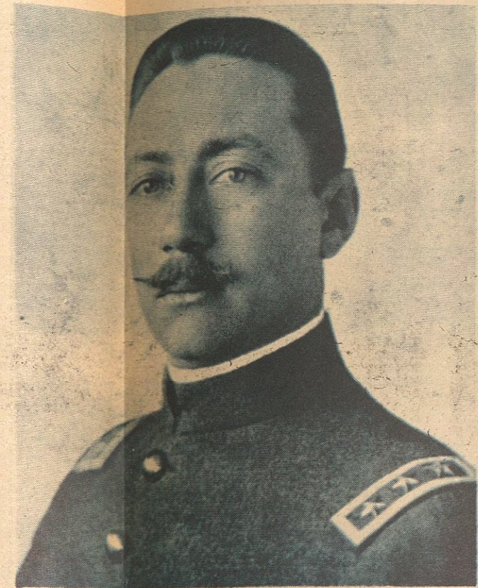
EL CORONEL Esteban Cantú Jiménez, en el cenit de su poderío como Gobernador y Jefe Militar del Distrito Norte en el año de 1918, a la mitad del Gobierno Constitucional de don Venustiano Carranza, quien le daría esa denominación, borrando la estigma porfirista de "jefe político"