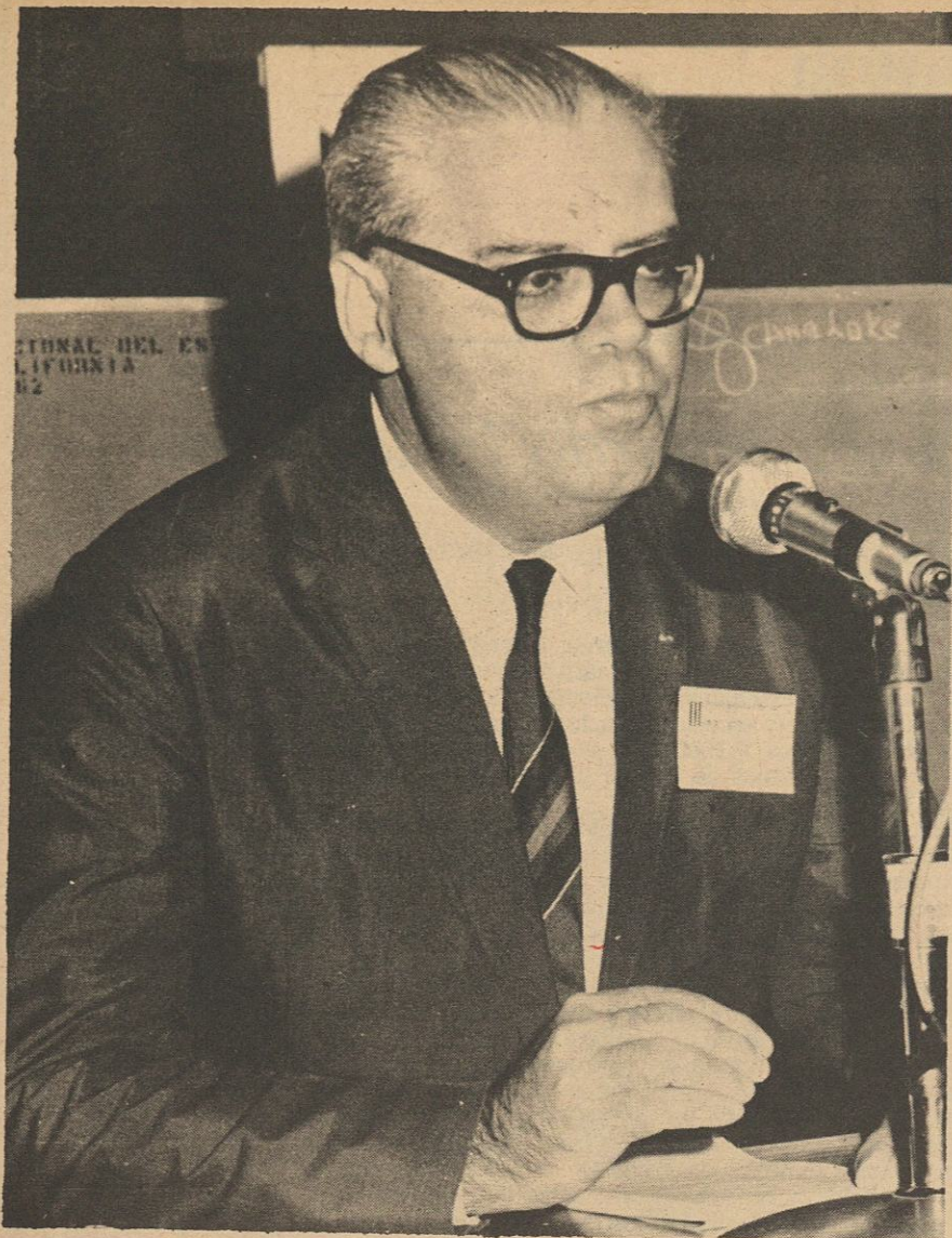
LINARES MALAGA, de la República del Perú.