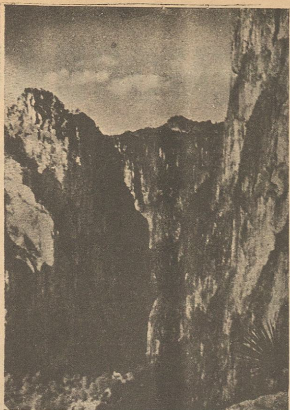
Anfiteatro de cantiles formado por la cascada de Basaseachi, en el mismo Estado, uno de los paisajes más imponentes de esa zona.