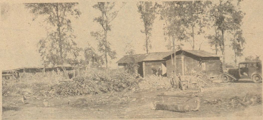
Por el año de 1929, algunos lugares de Mexicali por el rumbo de Pueblo Nuevo iban cediendo poco a poco al crecimiento de la ciudad, Lugares que habían sido los primeros ranchos algodonereros del Valle pasaban a ser barrios de la gran urbe.

"La división en zonas divide la ciudad en distritos apropiados para cada clase de actividad, basándose en las condiciones que ya existen y previendo las necesidades del futuro,