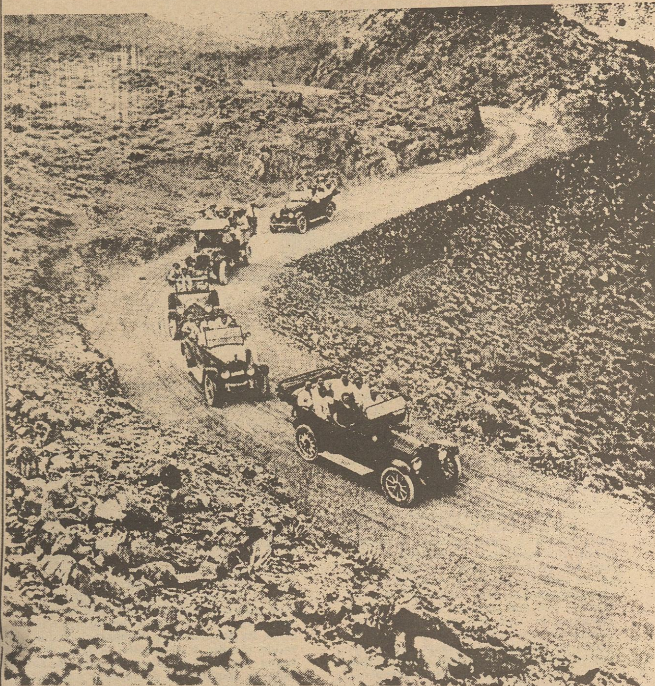
En 1919, Mexicali dió un gran paso en su progreso, al quedar comunicada por territorio mexicano con las demás ciudades del entonces Distrito Norte. En la foto, el coronel Esteban Cantú inaugurando el "Camino Nacional" Mexicali-Tijuana, construido por él. Camino que sería substituido despues por la Carretera Federal México-Tijuana.