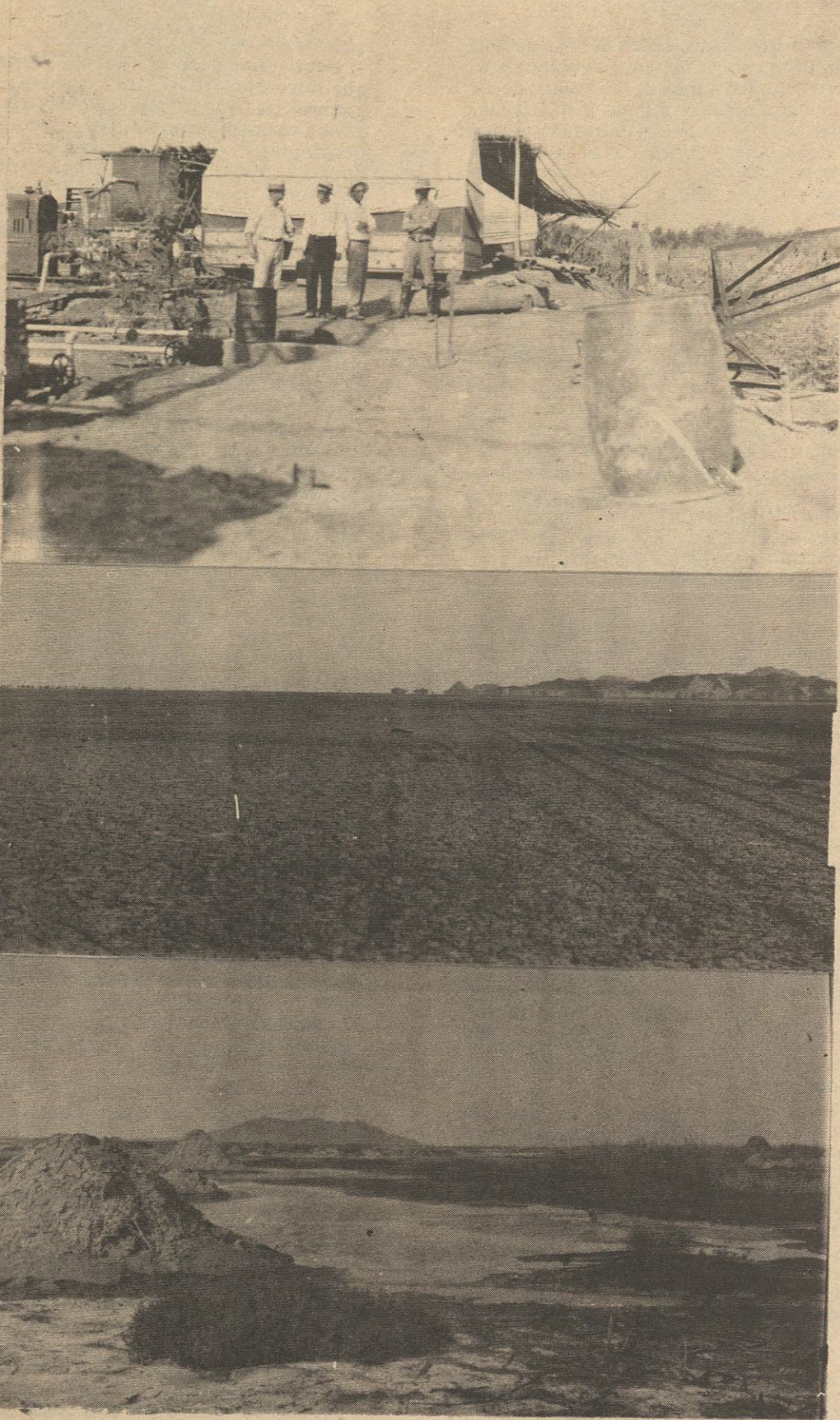
Tres interesantes fotos del Valle de Mexicali, arriba foto tomada el 18 de septiembre de 1929, en la planta de sifones en las obras de defensa del Rio Colorado (Bordo Rodríguez) Al centro, fotografía tomada en 1919 que muestra parte del "Desierto del Colorado" en una parte cercana a la Mesa Andrade. Abajo, la Laguna de los Volcanes en el año de 1923. Estas salvajes tierras serían poco a poco incorporadas a México, mediante la nacionalización y expropiación después para entregarse a campesinos mexicanos.

Bajo esa premisa, el general Abelardo L. Rodríguez planeó la colonización del Valle, siendo Gobernador del entonces Distrito Norte