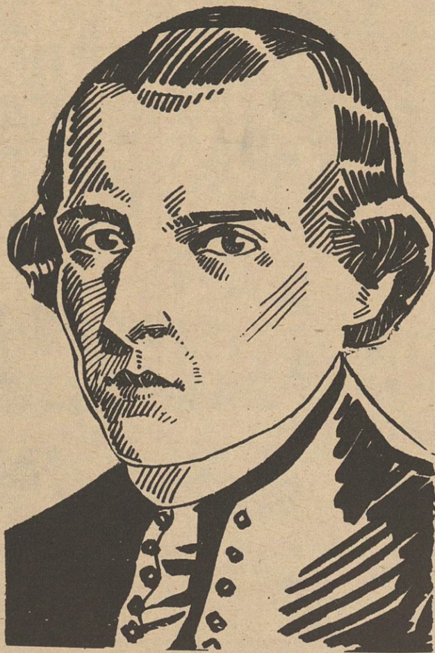
Francisco Javier Clavijero, historiador, poeta, humanista y sacerdote, cuyos restos mortales serán trasladados de Polonia, Italia, para ser depositados en la Rotonda de los Hombres Ilustres, por instrucciones del C. Presidente de la República.