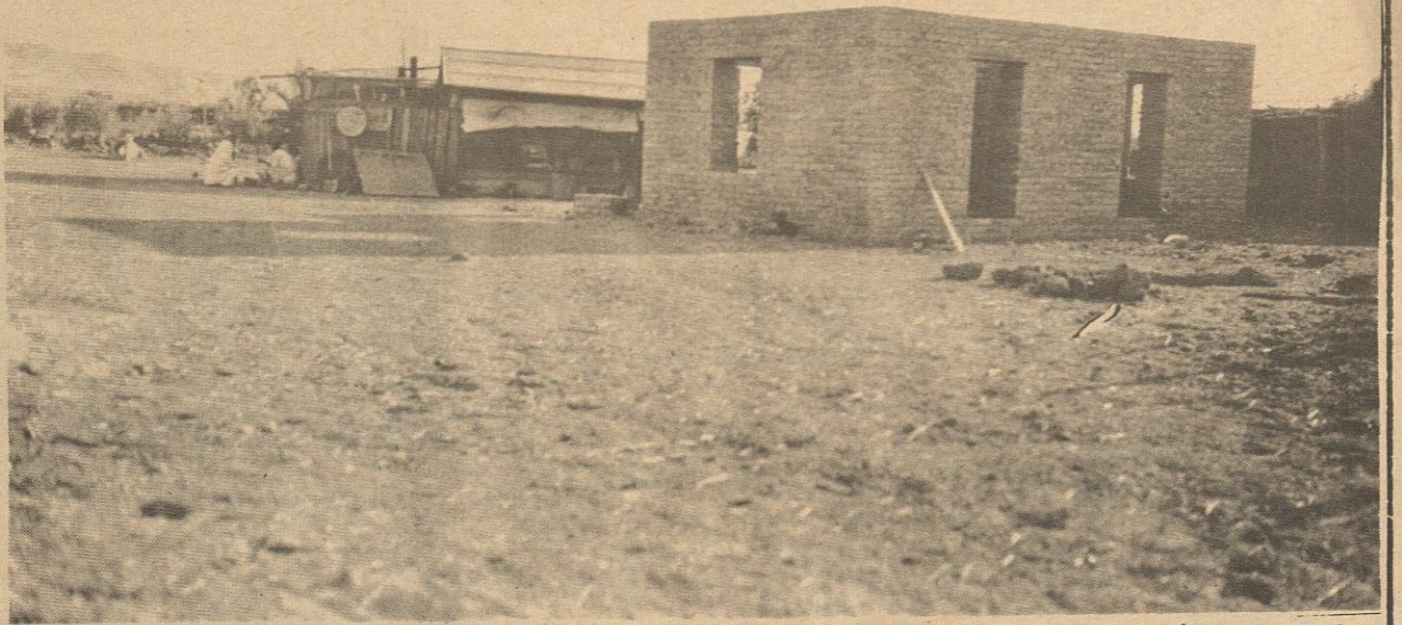
En junio, aniversario de la fundación de la Cooperativa, se celebraba ese acontecimiento con una barbacoa a la que asistían numerosas familias de la ciudad. Estos convivios eran ofrecidos invariablemente en honor del general Rodríguez, nacionalizador de esas tierras y fundador de esas colonias, las que puso en manos de mexicanos.