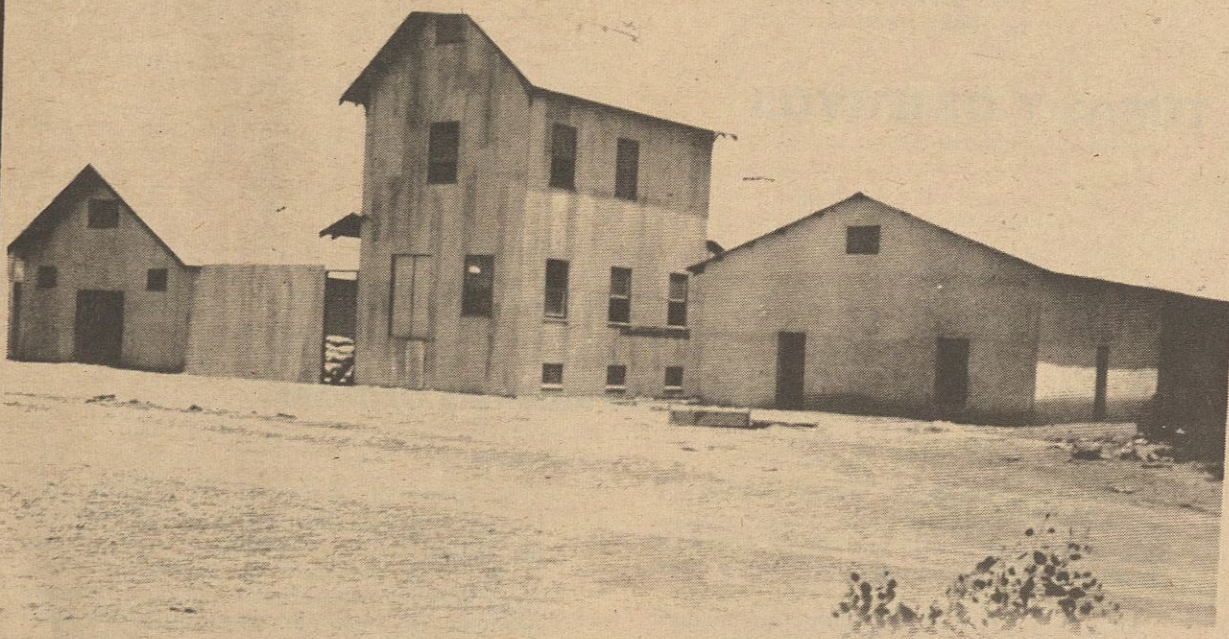
En septiembre de 1945 se inauguró la Planta Despepitadora Progreso, de la Colonia Agrícola del mismo nombre, y un año después, en 1926, el Molino Harinero, los almacenes a la izquierda y la Fábrica de Pastas Alimenticias. Al frente estaban los talleres de Mecánica, Herrería, Zapatería, y Talabartería, y la tienda de la cooperativa.