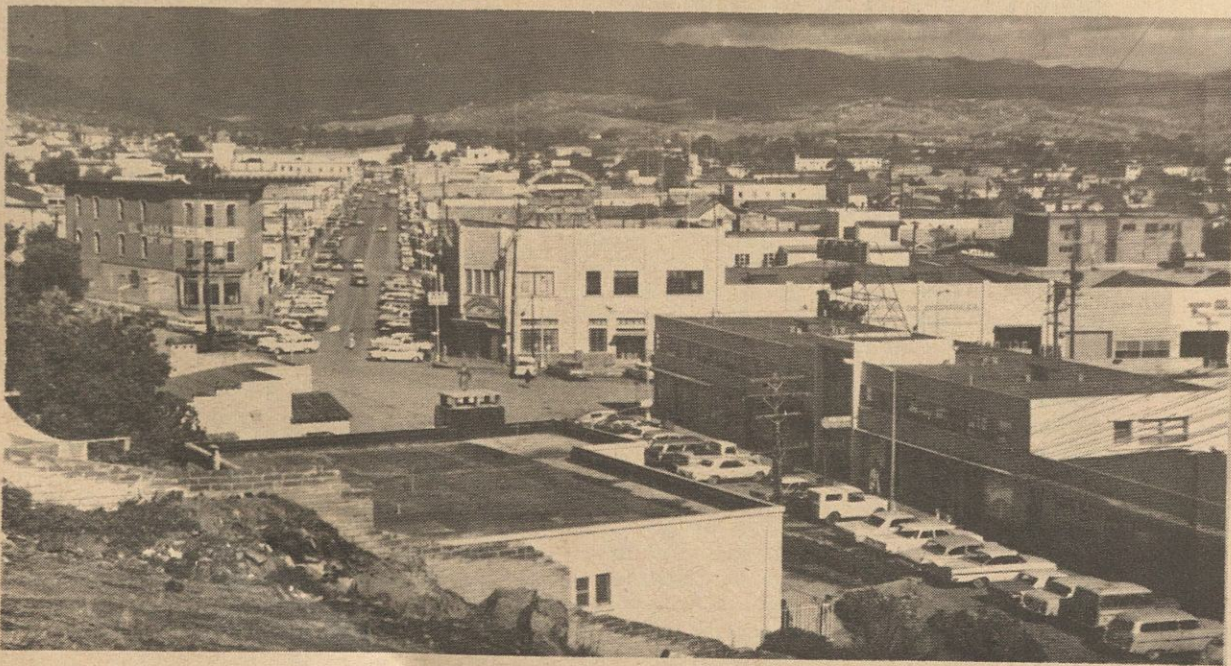
Una fotografía de la ciudad de Ensenada, Baja California, mostrando una de sus principales avenidas y algunos de sus modernos edificios y otros que han desaparecido para dar paso al progreso.

Carrillo y más tarde con el autor de "Estrellita", maestro Manuel M. Ponce.