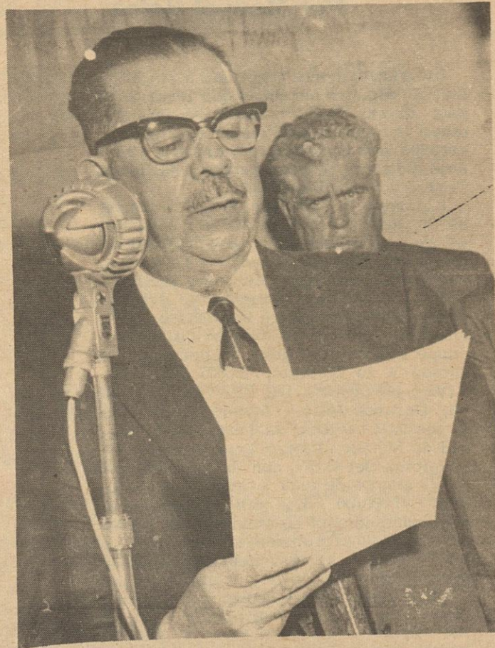
El General Lázaro Cárdenas, quien al anunciar su segunda visita a la entidad en 1939, como Presidente de la República, la que no realizó, la Policía Municipal de Mexicali preparó un Memorándum que le sería entregado en sus manos, en que se le pedía apoyara la sindicalización de esos elementos, como se había hecho con los empleados de gobierno.

Agobiados por el paracaidismo de influyentes y recomendados, los agentes del orden enviaron un Memorándum al Presidente Cárdenas que nunca llegó a sus manos